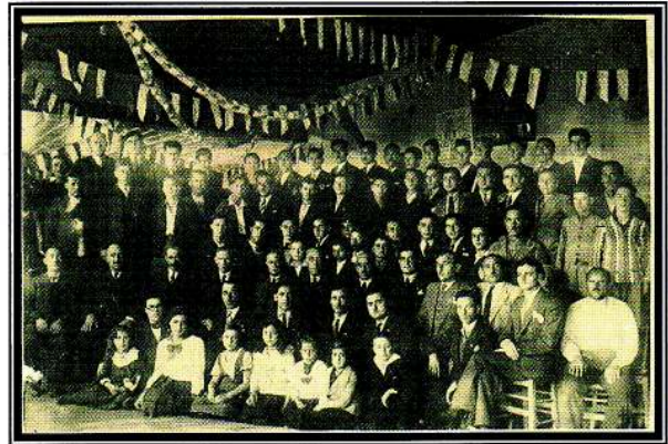
Η εκδήλωση που έχει πραγματοποιήσει η ένωση το 1933